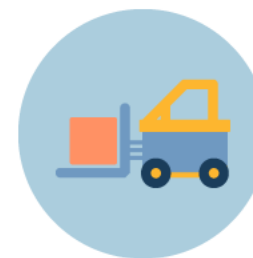
Uzglabāšana muitas noliktavā / brīvajā zonā